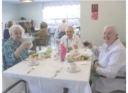
Provincia Holy Angeles