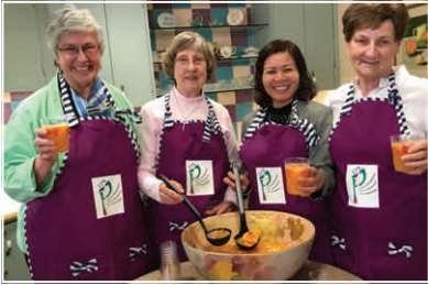
Provincia Mother Joseph