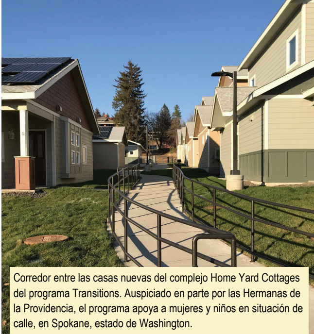
Corredor entre las casas nuevas del complejo Home Yard Cottages del programa Transitions. Auspiciado en parte por las Hermanas de la Providencia, el programa apoya a mujeres y niños en situación de calle, en Spokane, estado de Washington.