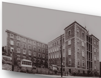
Hospicio Gamelin, hoy Centre d'Hébergement Émilie-Gamelin, en Montreal.

El martes 21 de septiembre: «Día de las Religiosas», ese día se llevó a cabo la celebración de las hermanas que estaban de bodas, la cual fue presidida por Monseñor