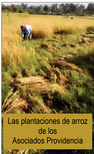
Las plantaciones de arroz de los Asociados Providencia

El domingo, luego de la misa, se conformaron los equipos. Las Asociadas y los Asociados se distribuyeron los diferentes sectores de la parroquia y cada cual tenía una lista de las personas que le habían sido asignadas. Cada grupo recibió la misión de ir a sembrar la alegría y la