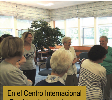
En el Centro Internacional Providencia durante una charla sobre la Misión