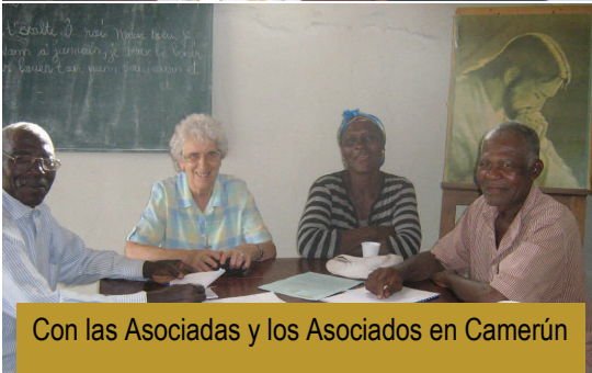
Con las Asociadas y los Asociados en Camerún