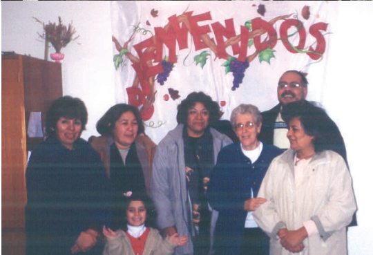
Con las Asociadas y los Asociados en Argentina