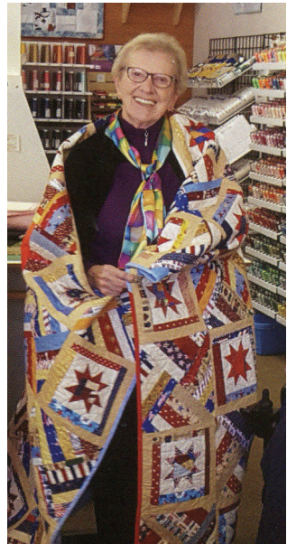
Roberta Sample, AP

asociada admitida en 1976, ella abrió la puerta a más de 250 asociados en toda la Provincia Mother Joseph. Por su servicio como enfermera del ejército en los años 60, el 10 de octubre se hizo merecedora de una distinción por parte de Quilts of Valor Foundation en Gresham, Oregón. En honor a su labor, y como un recordatorio del aprecio y gratitud que nuestro país guarda por los miembros del servicio, como ella, se le hizo entrega de un edredón fabricado a mano.