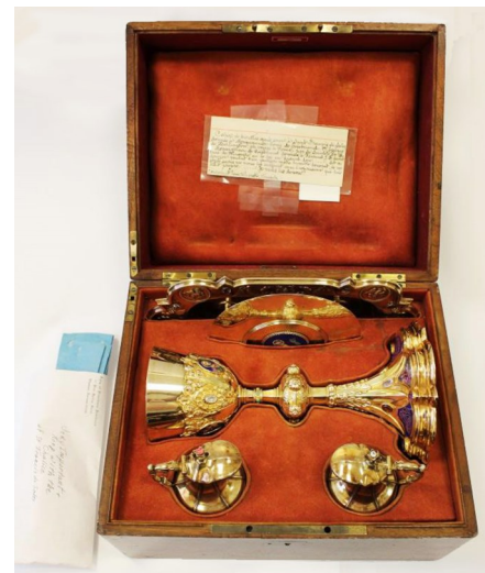
Conjunto litúrgico que perteneció a san Francisco de Sales mientras fue obispo.

Las decoraciones que adornan el conjunto litúrgico son de una encantadora belleza. Ciertas escenas y personajes bíblicos han sido representados de una manera muy colorida, además de ser adornados con gemas preciosas. La patena tiene una inscripción en latín que significa: « Es el pan bajado del cielo ». El conjunto de objetos litúrgicos fue donado al Museo de las Hermanas de la Providencia, en Montreal, en enero de 2019.