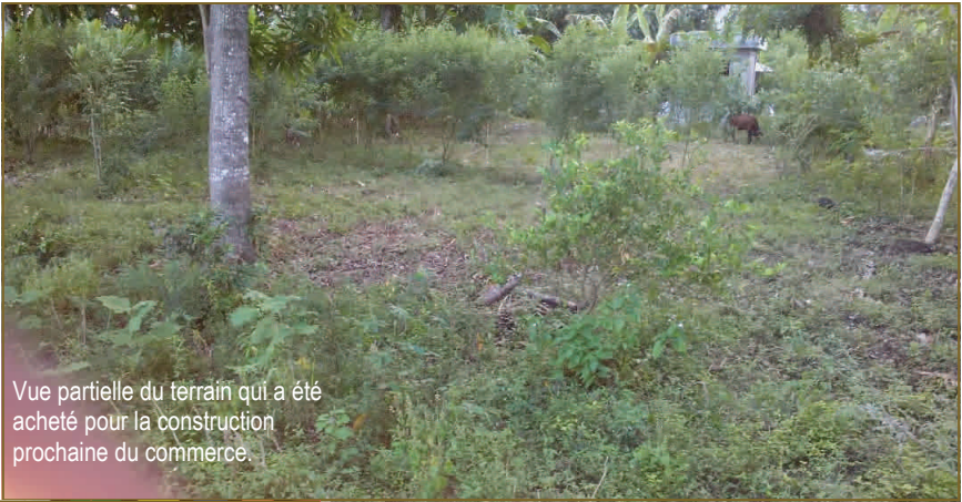
Vue partielle du terrain qui a été acheté pour la construction prochaine du commerce.