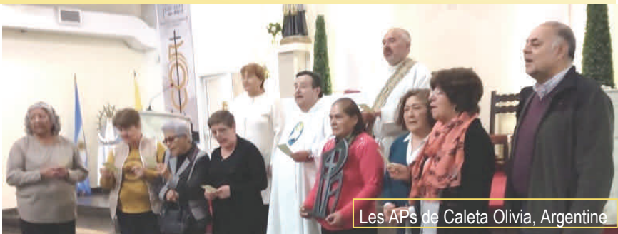
Les APs de Caleta Olivia, Argentine

Bureau de communications de la Province Bernarda Morin