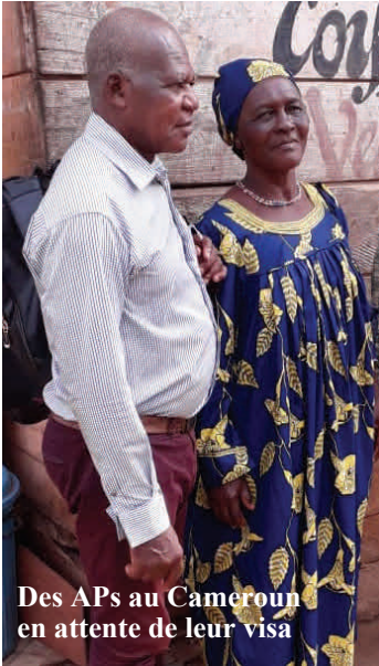
Des APs au Cameroun en attente de leur visa

métropolitaine ainsi que de tout le Québec.