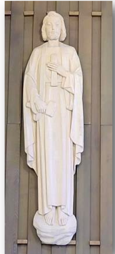
Estatua de San José en la capilla del Providence Centre

En este Año de San José, la Provincia Holy Angels se complace en compartir con ustedes una lista y fotos de hermanas cuyo nombre es José (Joseph), fotos de nuestras obras/misiones a las que se les ha dado el nombre de José, incluyendo información adicional, y una foto de la estatua de San José que se halla hoy en la capilla del Providence Centre, en Edmonton, donde, antes de la COVID-19, cientos de personas se unían a nosotras cada semana para celebrar la eucaristía.