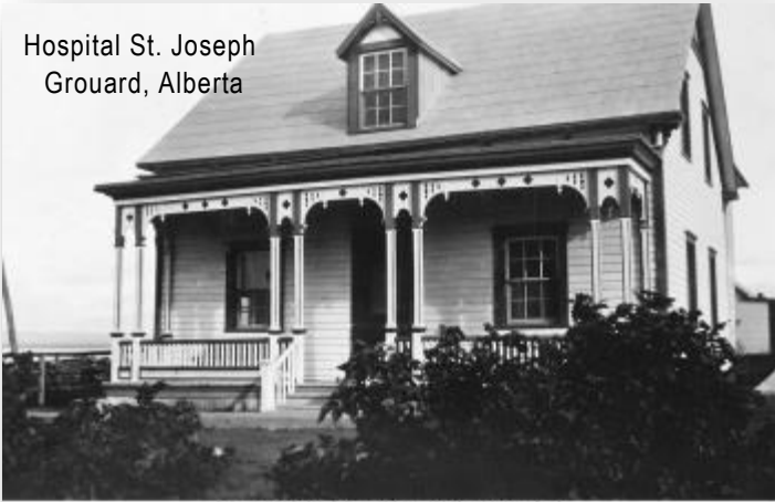
St. Joseph Hospital - Grouard, AB