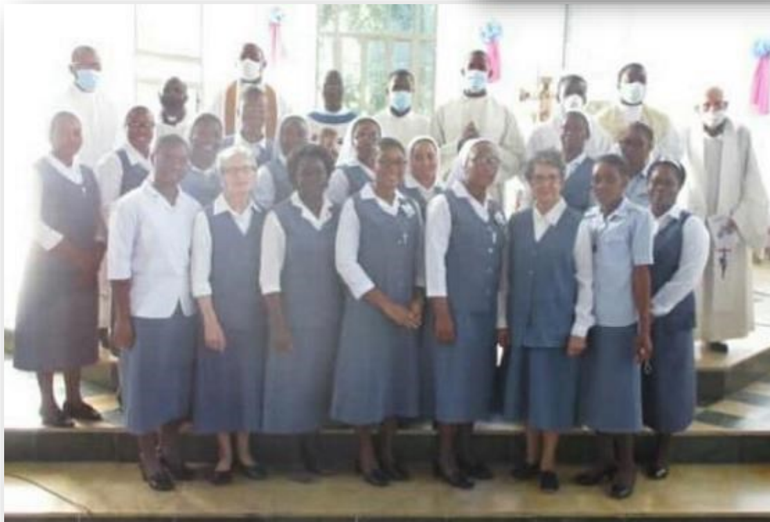
Las Hermanas de la Providencia presentes en Haití, acompañadas por los concelebrantes de la ceremonia.