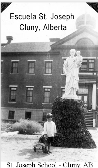
Escuela St. Joseph Cluny, Alberta