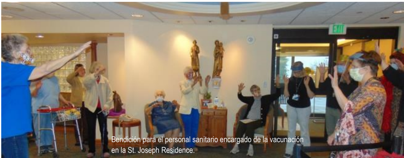
Bendición para el personal sanitario encargado de la vacunación en la St. Joseph Residence.