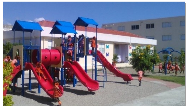
Escuela preescolar (maternal) en primer plano Escuela primaria al fondo

También ofrecemos un servicio de atención psicológica para ayudar a los alumnos con dificultades, así como a sus padres y profesores, en función de las necesidades del niño.