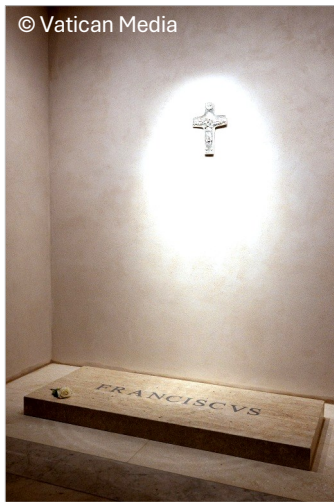
Tombe du pape François à la basilique Sainte-Marie-Majeure, à Rome.

Notre bien-aimé pape François repose près de la petite chapelle paulinienne ornée de l'icône de Marie Salus Populi Romani, où il s'agenouillait pour prier avant et après chacun de ses voyages. Nous avons senti la présence du pape François, notamment son amour profond pour les personnes pauvres et marginalisées. Cela a renforcé, en moi, notre propre mission et nos valeurs Providence, ainsi que le ministère de la bienheureuse Émilie Gamelin.