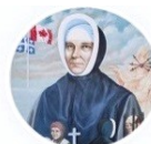
Musée des Sœurs de la Providence Museum

✉ 12055, rue Grenet, Montréal, QC H4J 2J5 Canada